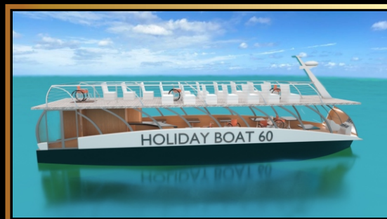
HOLIDAY BOAT SUN DECK 60 Pierwszy pasażerski 120-osobowy Katamaran WODOROWY